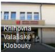
Knihovna Valašské Klobouky