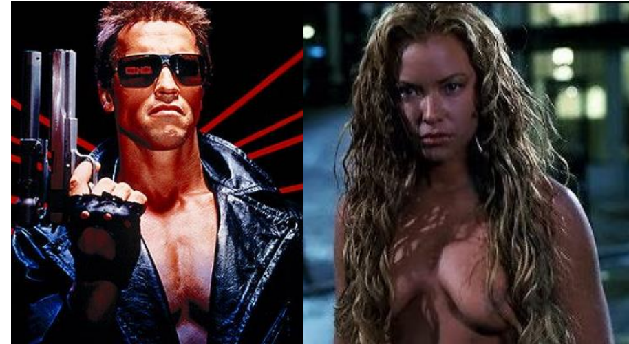
Terminátor (1984) - model 101 (1984) a Terminátor 3: Vzpoura strojů (2003) - model TX

robot AND stereotype AND (sci-fi OR „science fiction“)