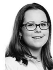
Autorka Anna Kottová

Na sociálních sítích se šíří pozvánka na plánované veřejné shromáždění na Václavském náměstí v Praze k uctění památky obětí střelby v Bratislavě. Pod příspěvkem se kromě vyjádření podpory objevil i nenávisťný komentář proti LGBT+ komunitě „Aspoň vím, kam mám jít se samopalem. dik.“ Policie autora komentáře vyšetřuje pro podezření z násilí proti skupině obyvatel a proti jednotlivci. Za výrok mu hrozí až rok vězení.